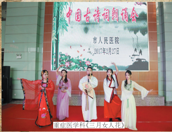
重症医学科《三月女人花》