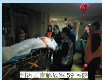
到达云南解放军59医院