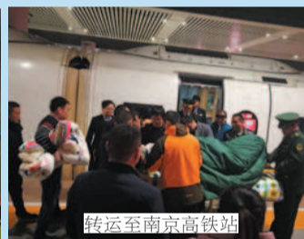
转运至南京高铁站

春节期间,宿迁一市民驾车前往云南拜访客户,经山路行驶时不慎翻下山崖,一家五口全部受伤,两人重伤。