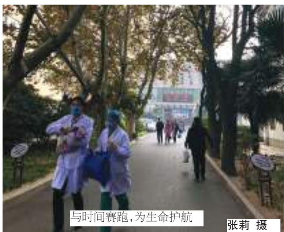
与时间赛跑，为生命护航

找差距，抓落实。作为一名普通的医务工作者，总要去面对很多现实的残酷，除了接受，只能不断积累经验，时常专研学习，通过不断实践发现自己的不足，及时补充，向带教老师学习，向前辈学习，向书本学习，努力扩展自己的专业知识，尽可能地让更多的患者减轻病痛的折磨。如果我们不好好学习、不好好对待患者，精于自己的专业，又怎能更好的为患者提供更精准的护理，又该如何去面对那一双双无