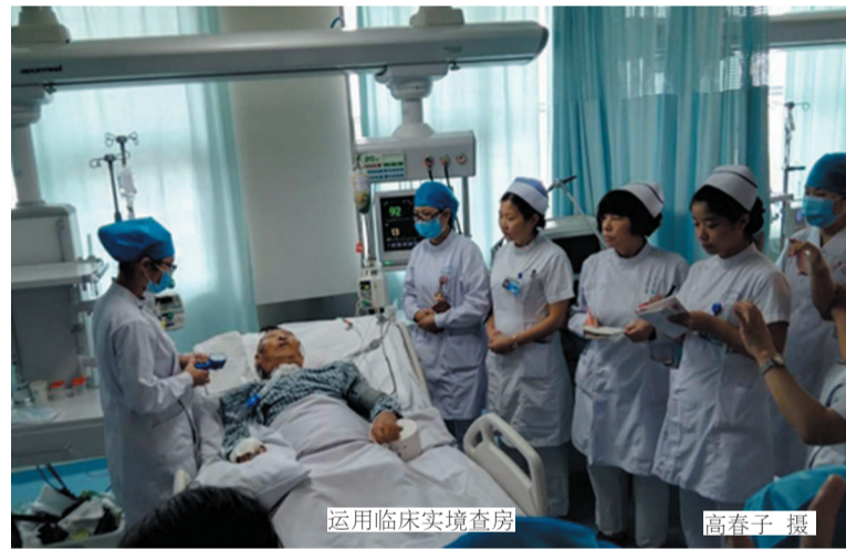
运用临床实境查房