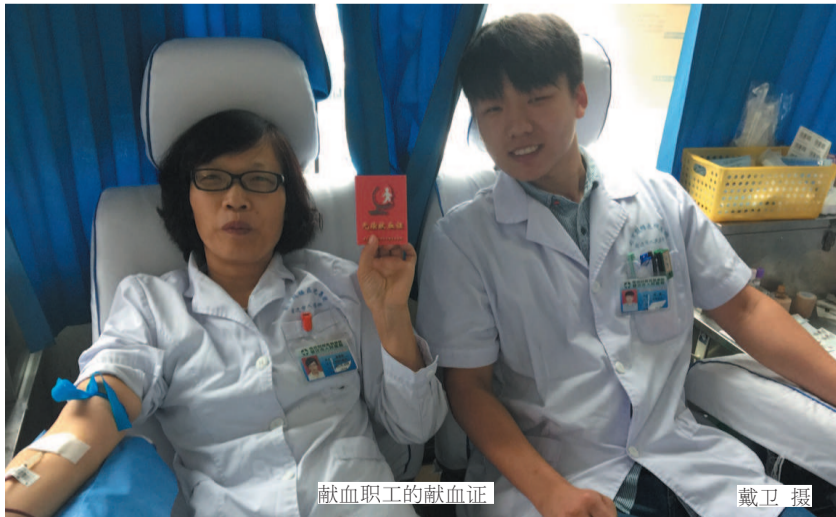
献血职工的献血证